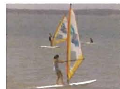
PLANCHE A VOILE— à partir de 10 ans

Tarif 3 jours (2h/j) = 90,00 € Tarif 5 jours (2h/j) = 148,00 €